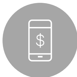
Tabela de preços