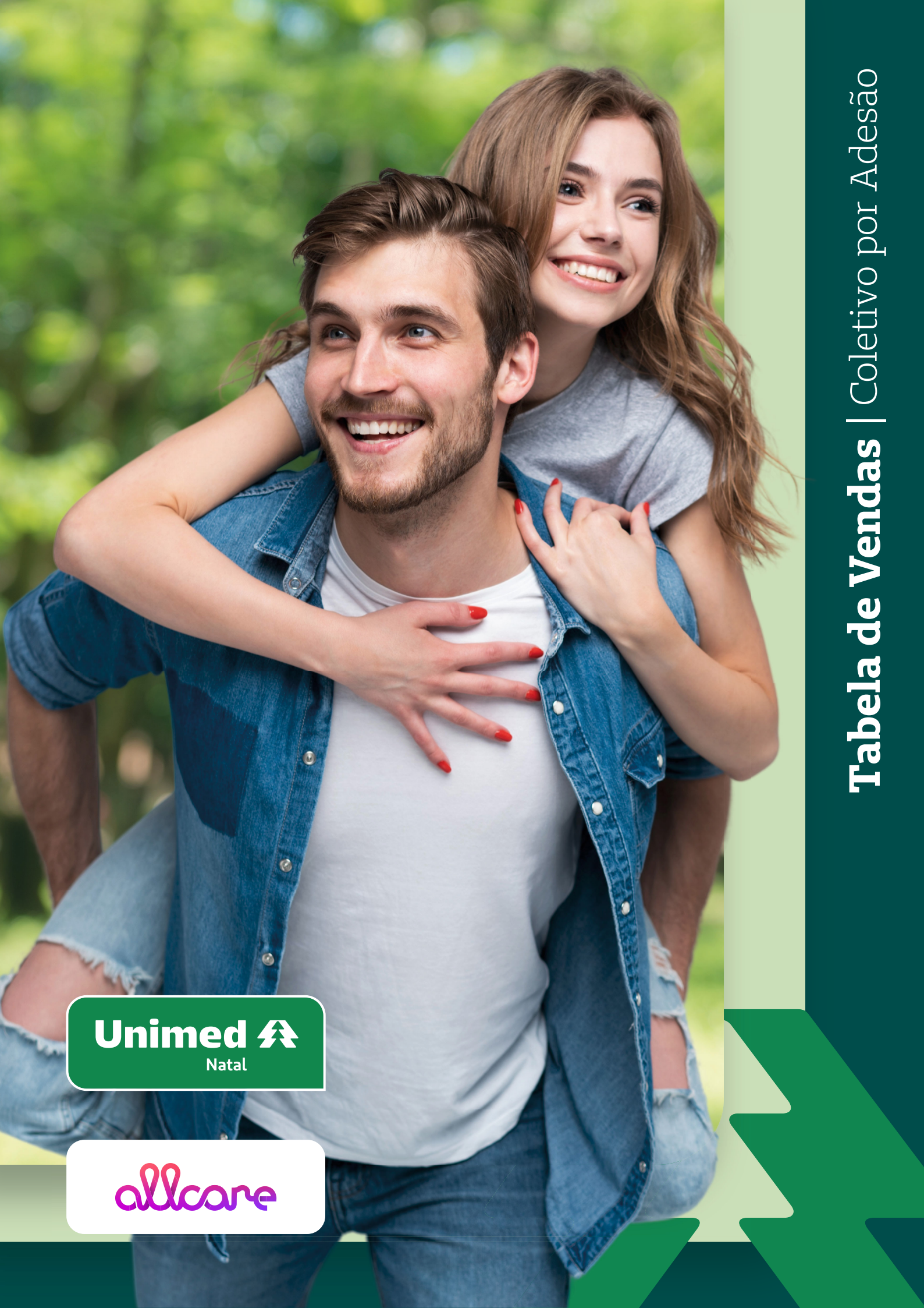
Tabela de Vendas | Coletivo por Adesão